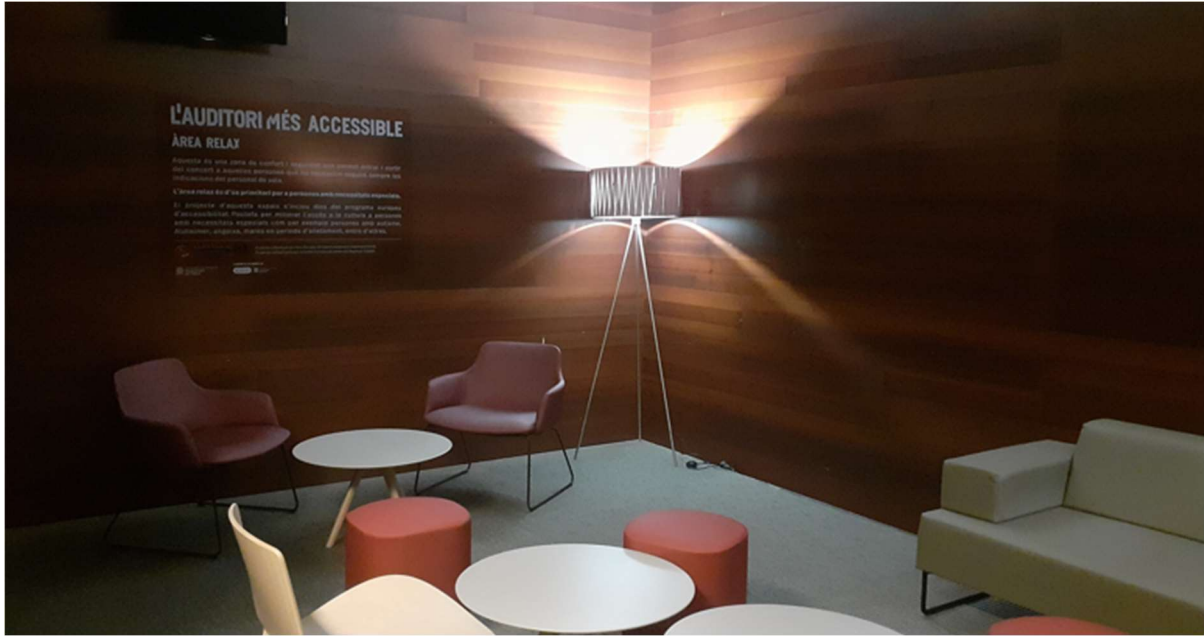
Espai relax de L'Auditori a la Sala 2